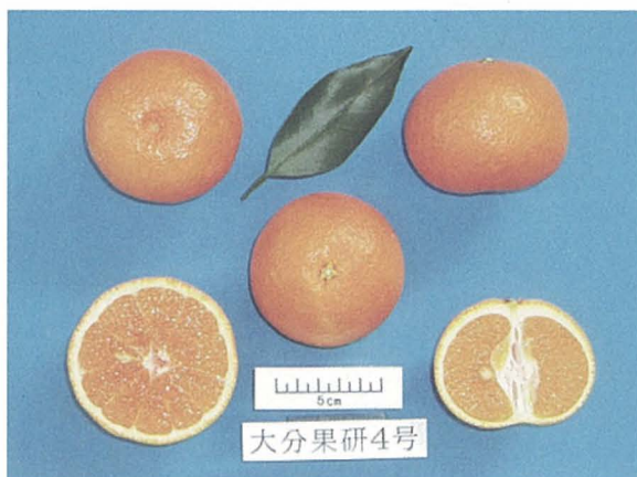
写真1 「大分果研4号」の果実