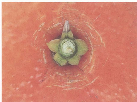
写真4 「大分果研4号」の果梗部亀裂（クラッキング）