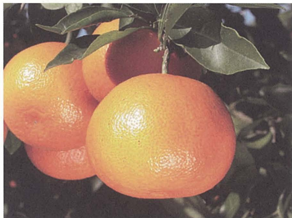
写真3 「大分果研4号」の結実状況

また、果皮が弱く、果肉が軟らかいため、収穫後に果実の軟化が進み、品質低下がみられることから、棚保ち性や貯蔵方法等については、今後、調査が必要である。