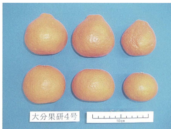
写真2 「大分果研4号」の果形のバラツキ