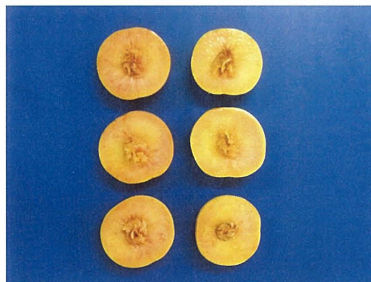
第4図 遮光率の異なる果実袋が「つきあかり」の果肉内紅色素の発生に及ぼす影響 1)