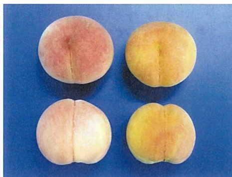
第1図 「つきあかり」と「あかつき」における果皮の着色 1) 2) 3)