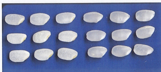
写真4 胚盤が残るように精米した「きんのめぐみ」

左：胚盤が残る精米 (2010年美郷町産米をトーヨーライス株式会社で精米、搗精歩合：91.2%) 右：通常の精米 (2010年育成地産米、搗精歩合：88.9%)