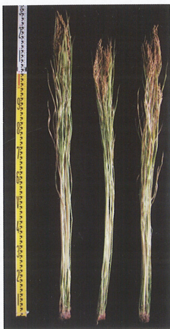
写真1 「きんのめぐみ」の草姿