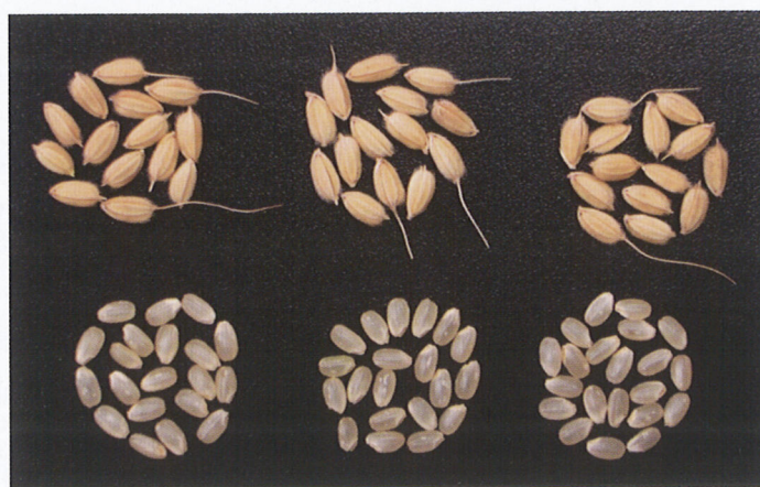
写真3 「きんのめぐみ」の粳および玄米