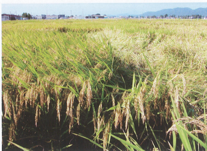
写真2 圃場における「きんのめぐみ」の草姿