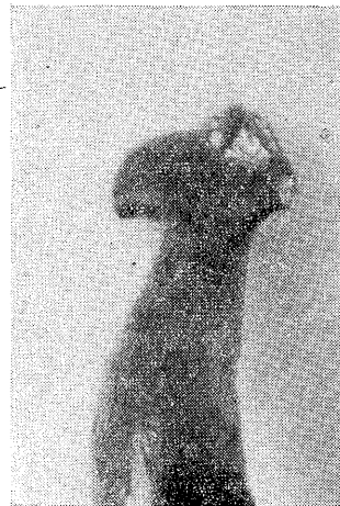
写真2 虫体の頭部 (背面)

は幅広で、断面は楕円形に近い形であった。体部後方はしだいに細くなり、尾部は鈍端であった。体色は、背面がビロード様の黒色で、腹面は暗灰白色を呈していた。しかし、頭部の腹面は体部より、やや明るい灰白色であった。腹面には、中央に歩帯とよばれる白いすじが頸