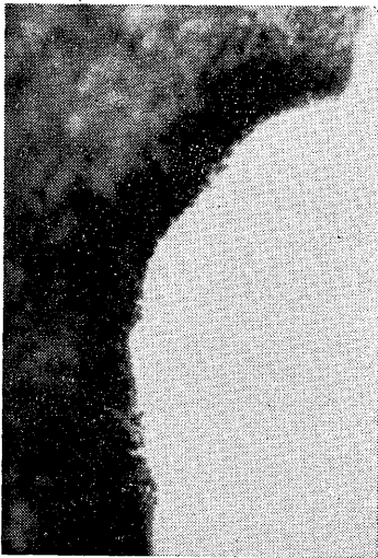
写真4 頭部辺縁に密集している眼点

部から尾端までみられた(写真3)。虫体を clove oil で透明化し、眼点の分布をみると、頭部辺縁から頭部辺縁、体部辺縁にかけて多数が播種状に存在している。とくに頭部辺縁に密集していた(写真4)。口は体長中央部よりわずか後方の位置、すなわち頭端より 57 mm に開口していた。生殖孔は、口から尾端までの前 1/3 の位置、すなわち頭端より 71 mm に開口していた(写真5)。