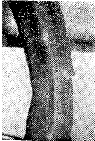
写真5 虫体々部（腹面）歩帯上に口（上方）と生殖孔（下方）がみられる。