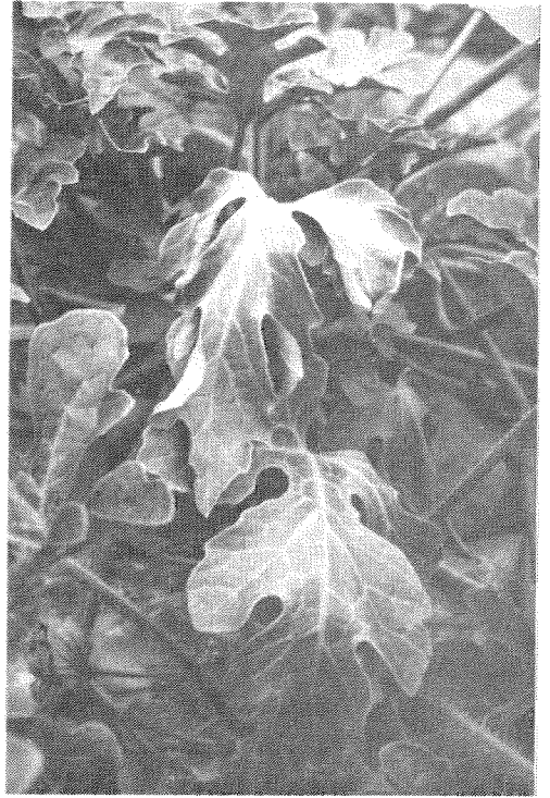
Fig. 2. Wilt symptoms of watermelon in Kyowa-cho

分離された Verticillium sp.は、微小菌核を多数形成する。暗褐色〜褐色で、その表面は粘質の膜様物質に覆われる。分生子柄は菌糸または菌核から直立して生じ、1〜6本のフィアライドを1〜5段輪生する。分生子柄の長さは75〜220 \mu m (平均166 \mu m) で隔膜数は5〜9である。分生子柄全体が無色である。分生子は、無色で楕円形で