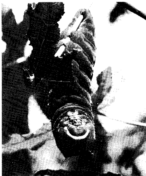
写真1. 天蚕の5齢幼虫

なお、アメリカフウはモミヂバフウとも呼ばれ、学名は、Liquidamber Styraciflua L で、雌雄同株の落葉喬木であり、大西洋岸諸州、メキシコに分布する・アメリカ、ドイツでは有数の公園樹となっており、日本へは昭和12年にアメリカより渡来、東京の上野公園のものが有名である。