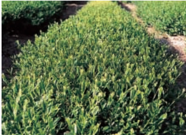
写真-1 ‘はるみどり’一番茶の生育状況