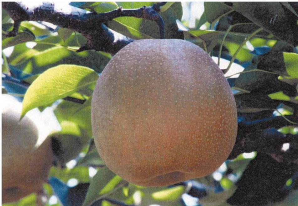
Fig.4. Fruit of 'Oushuu'.