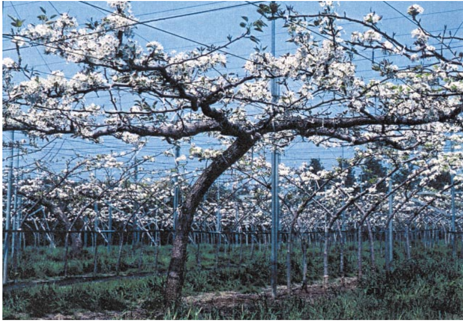
Fig.3. Tree form of 'Oushuu'.