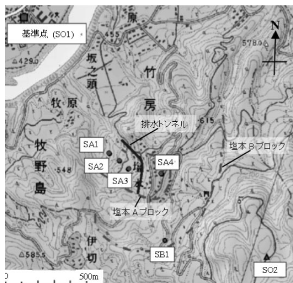
Fig.1 調査地区概要（1/25,000地形図「稲荷山」より） Survey Area

塩本区域には多数の地すべり地形がみられ、近年においても断続的に地すべりが発生している。地質は第三紀