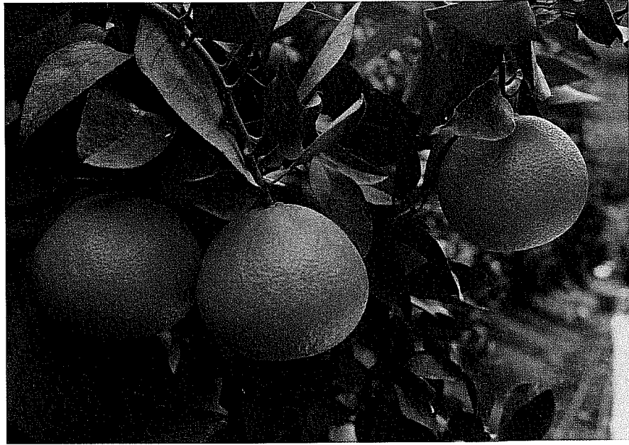
写真1 '愛媛果試第28号' の結実状態