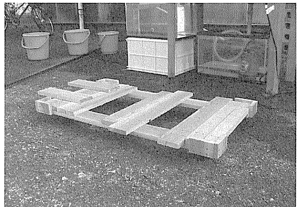
第4図 傾斜可変実験水路の移送用の台車

に供給され、水路内を通過後、小型水槽に流下して循環する。ボールバルブにより水路内の流量 (0-12L/min) を調節することが可能である。