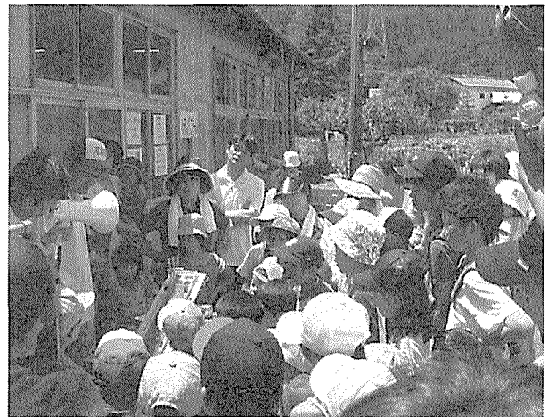
第5図 研究所一日開放事業において開催した公開実験「ヨシノボリとカジカのみわけかた」

傾斜可変実験水路を使用し、まず2006年7月30日に下呂支所での研究所一日開放事業において、特に小学生を対象とした公開実験「ヨシノボリとカジカのみわけかた」を2回行った（第5図）。この実験では、カワヨシノボリ