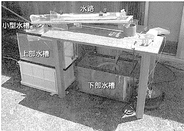
第1図 傾斜可変実験水路 (H18-FU型) の全容 初期傾斜を7度に設定した状態