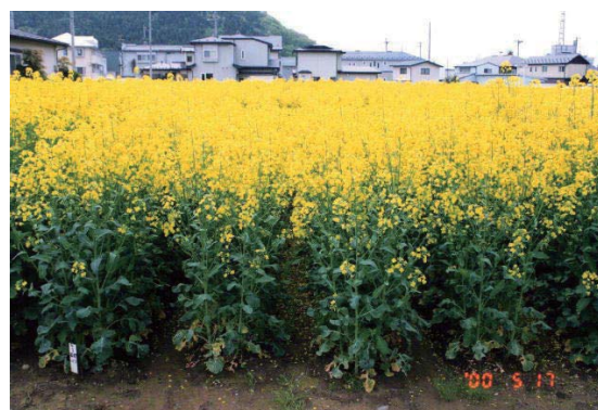
写真3 開花盛期の「キラリボシ」（育成地）