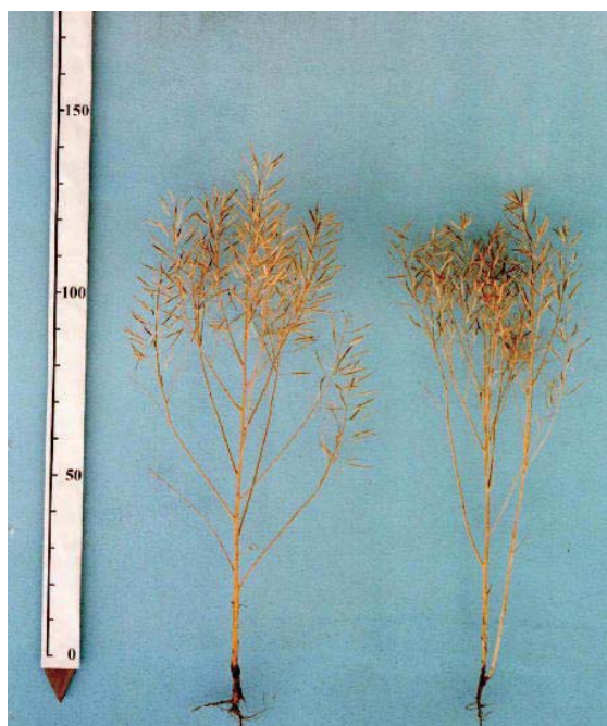
キラリボシ アサカノなたね 写真1 草姿（育成地）

環境負荷低減のため、農業関連分野においても農業由来有機物資源の地域内循環利用が求められており、環境や食の安全・安心等への関心の高まりから、今後各地で本格的な取り組みが期待されている（合田 2004）。畜産経営とうまく連携できれば、なたね粕を飼料用としてカスケード利用することができ、なたねを資源とした小地域で完結する循環システムを構築することも可能であろう。今後、耕畜連携の分野にも視野を広げ、資源循環型社会構築のための一材料として、「キラリボシ」が利用されることを祈念する。