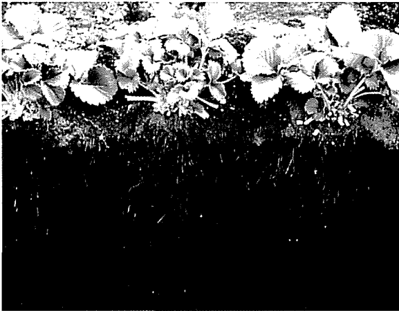
図1 不耕起作付け3年目のイチゴの根 (品種「女峰」2002年4月)

不耕起3作終了後のイチゴの根の状況を図1に示した。不耕起区でも根系は畝の底部深さ30cm付近まで広がっていて、耕起区との間は認められなかった。土壌の貫入抵抗値の調査結果を図2に示した。耕起区では深さ20cm前後の硬度が小さかったが、不耕起区でも畝の表面から底部となる深さ30cm付近まで、と