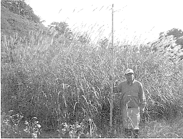
写真 1. ススキ属植物の遺伝資源収集 (北海道, 2006年9月).