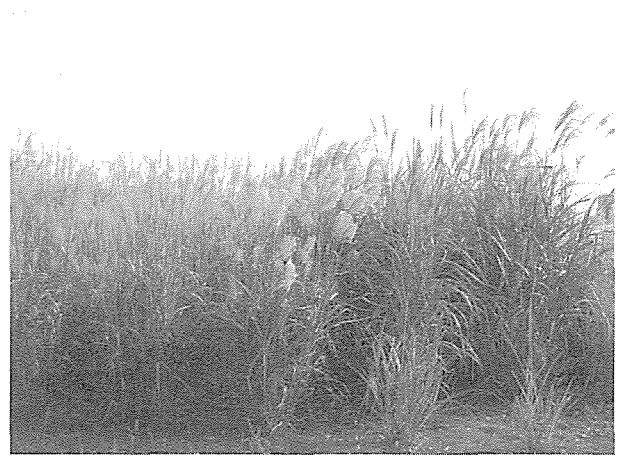
写真 2. ススキ属植物の特性評価試験 (北海道大学, 2008年10月).

技術が期待できる。具体的には、リグニン合成酵素遺伝子の発現を抑えてリグニン含量を減らす試みが、いまのところ主流である (Hisano ら 2009)。牧草における先行研究として、トールフェスクを用いてリグニン合成酵素遺伝子の発現を抑制する遺伝子操作により、リグニン含量の低減と家畜の消化性の向上が報告されている (Chen ら 2003, 2004)。スイッチグラスでは、リグニン合成酵素遺伝子の発現を抑えた形質転換植物体がすでに得られ、エタノール変換効率の調査が行われている (Wang 私信)。食品としての安全性評価を行う必要はないが、イネ科草種は風媒花であるために生態系への遺伝子拡散影響評価は必要になる。稔性のない遺伝子組換え植物が開発されれば、その実用化は近いと考えられる。著者たちは、ススキ属植物におけるカルス培養技術や遺伝子導入技術の確立を検討中である。