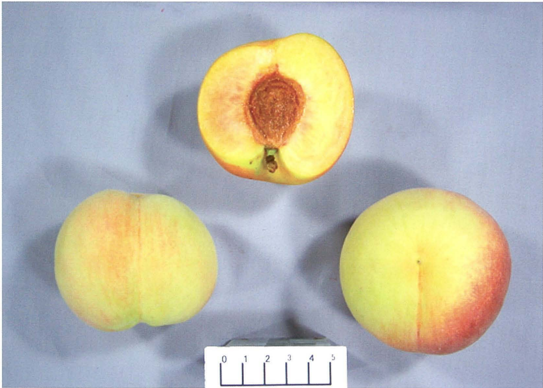
Fig. 2 Fruit of 'Tsukiakari'