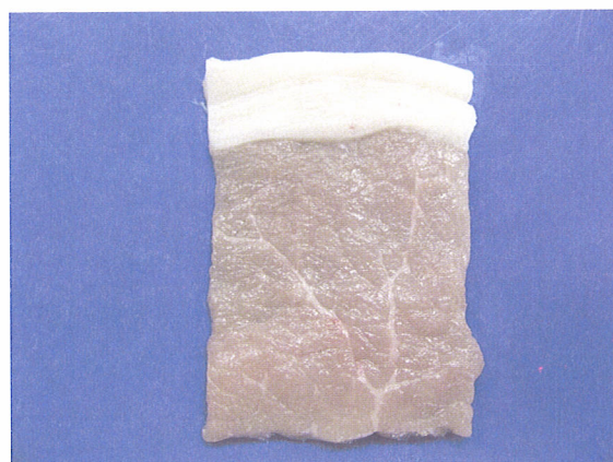
写真4 食味評価用サンプル

試験 2 の LWD の対照区と 20%区の 2 つの豚肉を比較する食味評価を「食肉の官能評価ガイドライン」 7) を参考に当研究所の職員 24 人で実施した．食味評価サンプルは，第 12 胸椎部位から最後胸椎部位の胸最長筋と背脂肪を冷凍貯蔵後，冷蔵室で 4℃，24 時間で解凍．厚さ 3mm×4cm×5cm(背脂肪 1cm+ロース肉 4cm)に整形し(写真 4)，1.5%食塩水に 10 分間浸漬し，表面の水分を除去した後，200℃に設定したホットプレートにて表面を 30 秒，裏面を 25 秒加熱し供試した．評価方法は試験区を伏せた状態で豚肉 A(対照区)を基準に豚肉 B(20%区)の食味を-2 から+2 の範囲で採点する方法で行った(図 1)．評価項目は「香りの良さ」「柔らかさ」「ジューシーさ」「甘みの強さ」「脂の滑らかさ」「総合評価」の 6 項目で，各評価項目について評価者全員の点数の平均値を評価点とした．