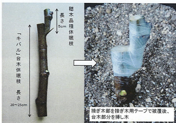
第1図 接ぎ挿しの方法

各試験区20本を供試し、植え付け密度は列間80cm、株間20cmとした。肥培管理は、挿し木後の4～8月は土壌が過乾燥とならないように適宜かん水を行い、追肥は6、7月に各1回、油粕を1本あたり20～30g（N成分で1～1.5g）程度施用した。