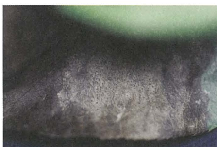
写真2 ナシ炭疽病の大型病斑