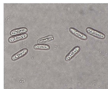
写真4 罹病葉から分離した Glomerella cingulata の分生子