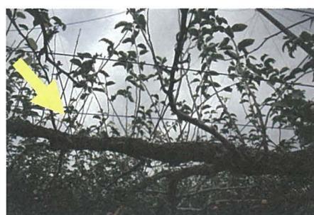
写真3 ナシ炭疽病により早期落葉したナシ樹