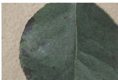
写真1 ナシ炭疽病による微小黒点