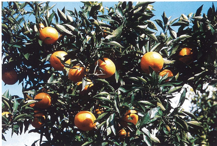
Fig. 3. Fruiting shoots of 'Harehime'.