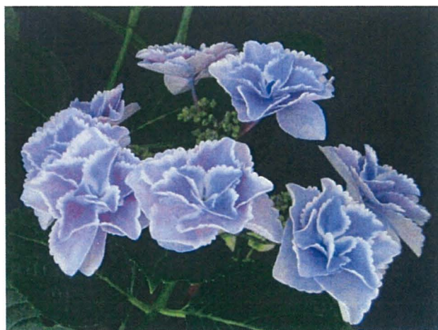
第4図 青系色の「きらきら星」