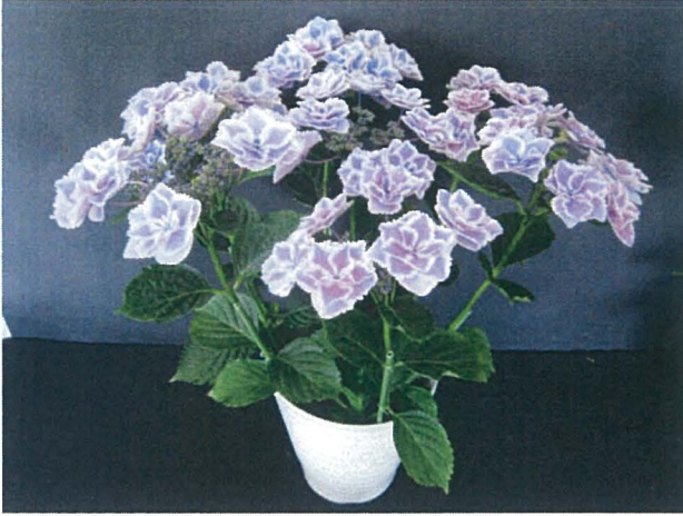
第1図 アジサイ新品種「きらきら星」