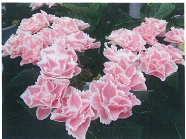
第5図 ピンク系色の「きらきら星」