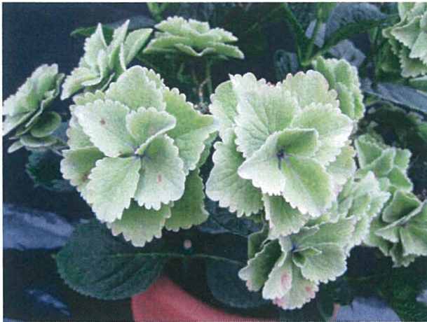
第3図 「きらきら星」の装飾花の移行性（左：夏の緑色，右：秋の赤色）