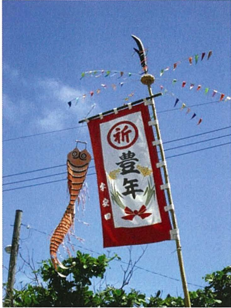
図3 国頭村安田区のシヌグ祭祀の旗 豊年旗（右）とムカデ旗（左）

方言ミーミジと呼び、さらに方言ミーミジグサはクスノキ科スナズル（方言オーヌジグサ、ニーナシハジラともいう）をさし、ミミジグサについては再考の余地がありそうである。