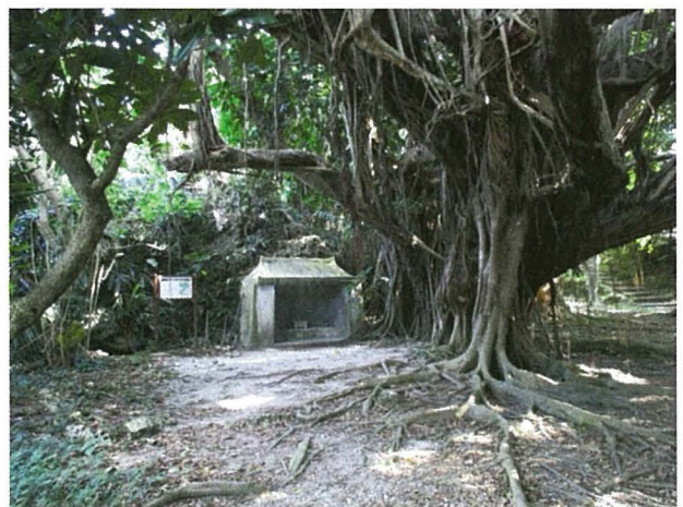
図4 シヌグ堂（浜区） 祠の前に茂るガジュマルの気根の叢生

比嘉小学校 6) が調査した年中行事コース、民話伝説コースの報告を概説すると、シヌグは旧暦6月28日と8月28日の年2回行われるが、祭事の内容は両月とも同じである。比嘉区の神人たちは、6月は西、8月は東の方から二才頭2人とグループのじいさんなどを連れ添って浜区に行った。神人たちの衣装はニーガミとワカヌールは白でタオルを被っていた。道の途中のアジマー（四つ角）では「ユウベ」と3回唱えた。ソージアジマーで一休みし、二才頭たちは神人たちと分かれて、ウーアブガマに石を3つ投げ入れた。神人たちはクボーから浜区の方に出て広場（スガリ）で待ち合わせ、浜区のハルマーイ（畑を回る）して世果報を祈願してきた神人と合流する。二才たちが捕まえた鼠を、マカヤー（和名チガヤ）をヒジャイノイ（左廻い）した縄でくるくる縛り、長さ50cmくらいの縄でぶら下げ、それを浜の潮の満ち干するところ、3月3日の石に鼠を供えて拝み、次に浜の渡し場の砂が積まれているところに供え「今日はシヌグの日で、シヌグをしにきたのであるが、あな方が生まれ育ったところはギノギ（キツキともある）島ですから、どうぞ向こうの島でくらしなさい」とみんなで拜んでその鼠たちを海に渡した。それから神人たちは浜区のシヌグ堂に行き、ごちそうを供えその後神人たちが分けあって感謝していただいた（図4）。