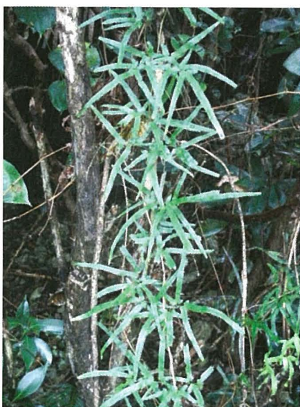
図1 道端の林縁に生えるナガバカニクサ 葉は他物に巻き付いて長く伸びる

戸内)、カラスバカズラ (沖縄)、カンツル (京都)、ゲンシヤ (静岡)、サミセンカズラ (中国地方)、シャミセン (長崎)、シャミセンカズラ (岡山・山口・鹿児島)、シャミセングサ (愛知・和歌山)、シャミセンズル (岡山・熊本)、ピンピンカズラ (岡山)、ピンピンカズラ (和歌山・岡山・山口・宮崎)、ピンピングサ (岡山・和歌山)、ペンペン (静岡)、ペンペンカズラ (岡山)、ペンピングサ (千葉・福岡・長崎)、があり、いずれもこの草の芯を引っ張って三味線のように弾いて遊ぶところからという。その他ツズラカズラ (和歌山)、ツルシノブ (和歌山・広島)、ホタルグサ (山梨) がある。