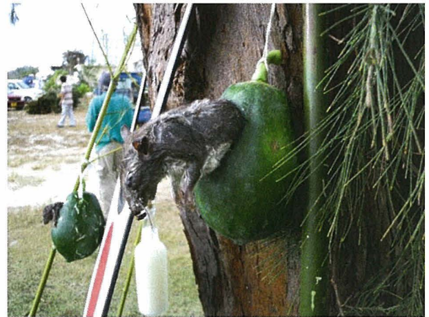
図5 国頭村奥間・比地区のウンジャミ パパイアの実に入って吊るされたネズミ

神となり、根津とは鼠の謂れで、根津権現社は鼠害を静めるために鼠を祝い込めた社でという。「およそ鼠ほど嫌い悪まれる物は少ないが、段々説いた所を総合すると、世界の広き、鼠を食って生き居る人も多く、迷信ながらもこれを神物として種々の伝説物語を生じた民もあり、鼠も全く無益な物ではないと判る」と結んでいる。