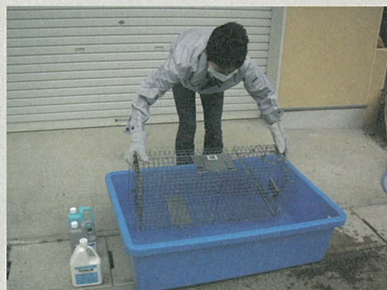
写真2 捕獲後の洗浄・消毒作業