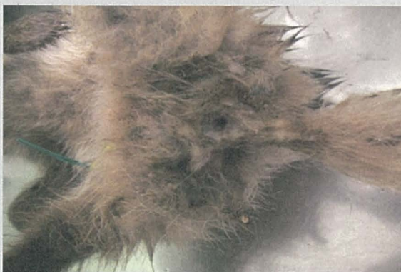
CDV で死亡したタヌキの肛門周囲の汚れ