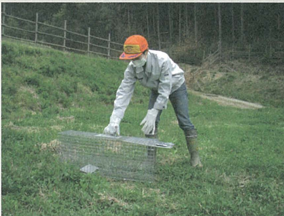
写真1 捕獲作業時の装備