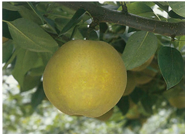
Fig. 3 Fruit of 'Kanta'.