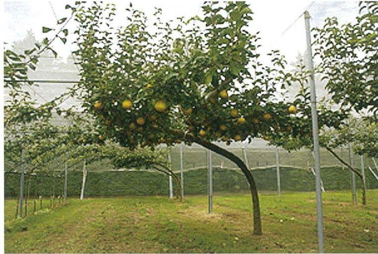
Fig. 2 A bearing tree of 'Kanta'.