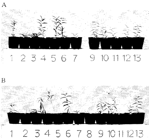
湛水開始14日後の生育状況。A: 対照, B: 湛水 1: 筑波1号, 2: 筑波2号, 3: 筑波3号, 4: 筑波4号, 5: 筑波5号, 6: 筑波6号, 7: 筑波7号, 8: 筑波8号, 9: 筑波9号, 10: 筑波10号, 11: 秩父野性モモ, 12: ネマカード 13: おはつもも

実生当年生苗をビニルポットに植えて湛水処理をし、台木用品種、系統の耐水性を比較した結果、いずれの品種、系統とも湛水14日経過しても地上部への影響は少なかった(写真1)。特に筑波9号では処理後14日に至っても地上部への影響は全く認められなかった。