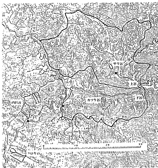
図-1 試験流域の位置 Fig 1 Location of study site ● : 雨量計 ● : rainfall gauge

有地（タロガ谷）に2カ所の計11カ所を設定し、最低標高地点で採水した。図-1に採水流域と流域界を示した。芦生演習林は日本海に注ぐ由良川の上流に位置し、冬期に降雪の多い日本海気候である。標高はおよそ450～950m、年平均気温および降水量は演習林事務所（標高400m）付近で11.0℃、2370mm、長次谷（標高636m）で9.0℃、2770mmである。降水量は3地点で測定し、調査期間（1990年4月20日～12月29日）の平均降水量は1844mm、平均気温18.1℃であった。地質は秩父古生層上・中部に属し、基岩は粘板岩、珪岩が多く、他に砂岩、硬砂岩、角岩などである。各集水域の植生等の概要を以下に記す。