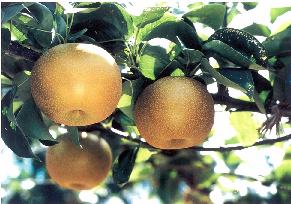
Fig. 3. Fruiting branch of 'Akizuki'.