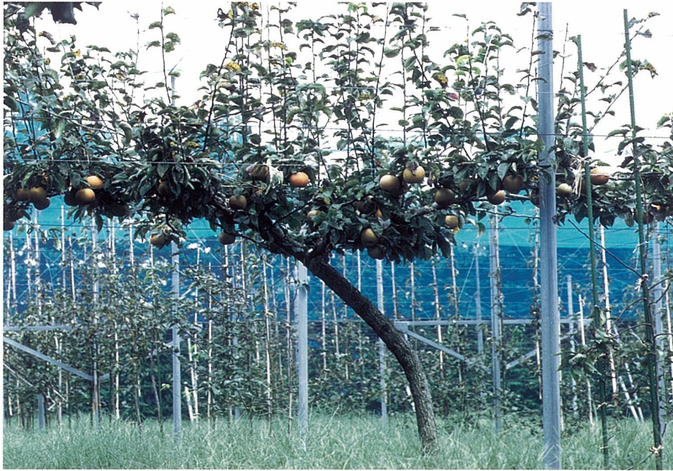
Fig. 2. Tree shape of 'Akizuki'.