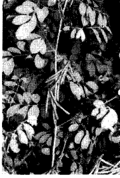
写真-1. キアイ Photo.1 Indian indigo ( Indigofera tinctoria )