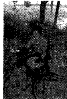
写真-4. 沈殿藍の製造 Photo.4 Indigo paste making