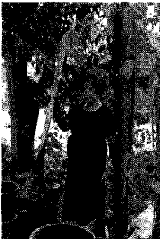
写真-5. 沈殿藍の搅拌棒 Photo.5 Bamboo whisk for stirring