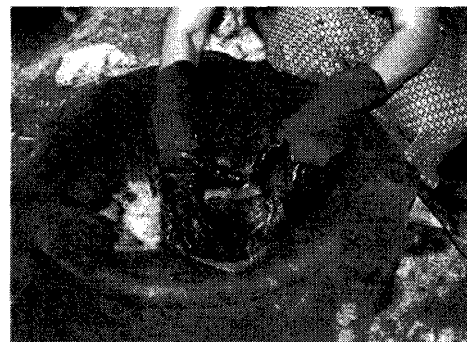
写真-8. タイコクタン染め Photo.8. Thai ebony ( Diospyros mollis ) dye