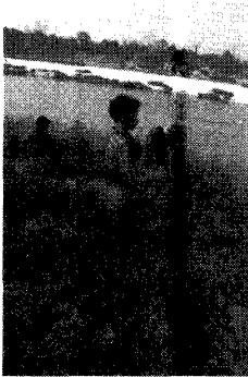
写真-3. 生葉と種子の収穫 Photo.3 Harvest of leaves and seed