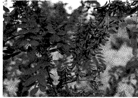
写真-2. ナンバンコマツナギ Photo.2 West Indian indigo ( Indigofera suffruticosa )