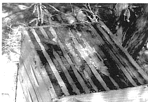
図 2 巣箱上面を完全に網で覆い、この網の目にミツバチが付着させるプロポリスを網ごと採集する.