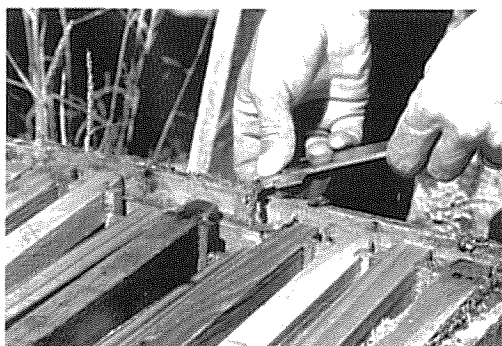
図 1 くさび法では、巣箱と蓋の間の隙間に堆積したプロポリスをハイブツールなどでかき取る.

2) プラスチックネット: 長さ 55 cm, 幅 45 cm のプラスチック網 (網戸用の網の同等品) を蓋の内側、巣板上部に置いた. ミツバチはこの網目の穴にプロポリスを充填する傾向がある (図 2). プロポリスが付着した網は -18°C に冷