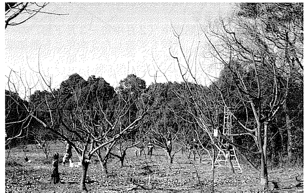
写真1 せん定後の樹姿(左:誘引区、右:慣行区)