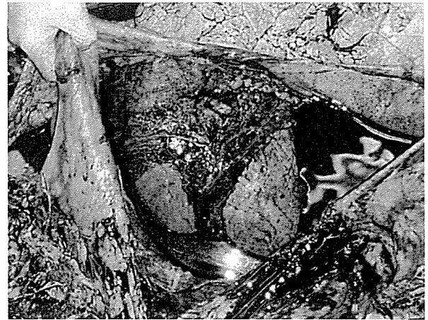
図2 病理解剖により拡張した心嚢内に多量の血様心嚢水の貯留を認めた。