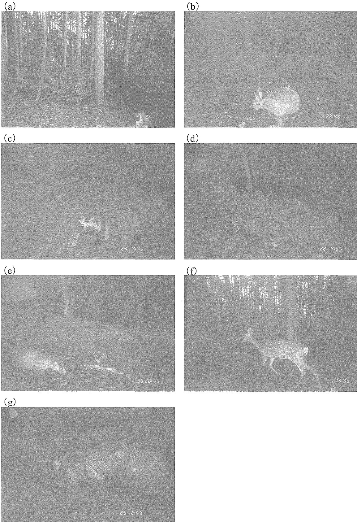
図-1. 自動撮影カメラで撮影された哺乳類. (a) ニホンリス (2007年1月1日, 人工林区), (b) ニホンウサギ (2007年8月2日, 広葉樹林区), (c) タヌキ (2006年12月24日, 広葉樹林区) (d) ホンドテン (2007年2月22日, 広葉樹林区) (e) ニホンアナグマ (2007年8月30日, 広葉樹林区) (f) ニホンジカ (2007年9月1日, 人工林区) (g) イノシシ (2007年5月25日, 広葉樹林区)