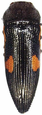
Fig. 7. Acmaeodera luzonica Nonfried キボシフナガタタマムシ (昆虫標本番号24-0461692), 体長10.0 mm.