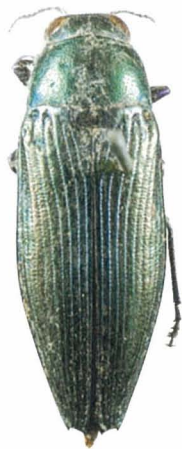
Fig. 3. Eurythyrea tenuistriata Lewis アオタマムシ (昆虫 標本番号24-0461265), 体長19.8 mm.