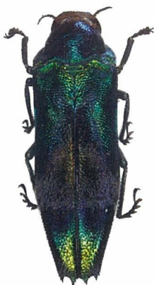
Fig. 11. Coraebus hastanus oberthurei Lewis ミドリナカボソタタマムシ (昆虫標本番号24-0461387), 体長11.0 mm.