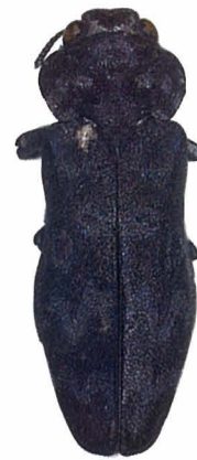
Fig. 10. Toxoscelus auriceps auriceps (Saunders) クリタタマムシ (昆虫標本番号24-0461371), 体長4.5 mm.