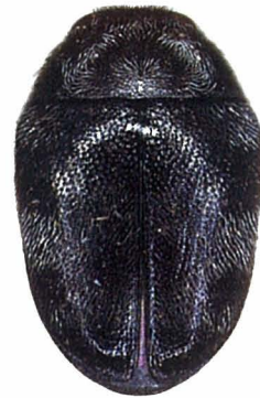
Fig. 8. Paratrachys hederiae hederiae (Saunders) ミスジツブタタマムシ (昆虫標本番号24-0461219), 体長3.5 mm.