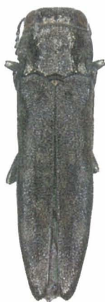
Fig. 5. Agrilus auriventris Saunders ミカンナガタマムシ (昆虫標本番号24-0461794), 体長7.2 mm.