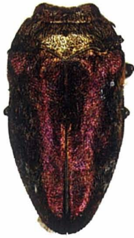
Fig. 13. Trachys cupricolor Saunders ドウイロチビタマムシ (昆虫標本番号24-0461966), 体長4.0 mm.