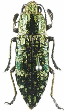
Fig. 2. Nipponobuprestis querceti (Saunders) クロマダラ タマムシ (昆虫標本番号24-0462088), 体長19.5 mm.