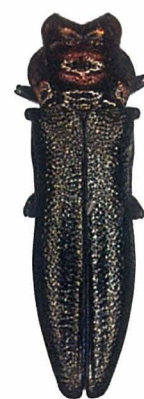
Fig. 12. Endelus collaris kerremansi Théry キンイロエグリタタマムシ (昆虫標本番号24-0461943), 体長5.5 mm.