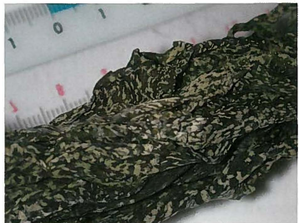
図 1 表面に白い斑点が生じた乾燥ワカメ

持ち込まれた乾燥ワカメ（長さ 31cm 重さ 17.1g、以下検体と称す）は、葉状部全形ではなく、先端を含んだ上部側のみであった。葉体の厚さと横幅から、老成した個体と判断された。検体には肉眼で白い斑点が全面に見られた（図 1）。そこで、検体表面の斑点の長さと幅を、任意の 10 カ所についてノギスで測定した。その後、検体を室温で滅菌海水に 1 時間浸して戻したのち、全面を光学顕微鏡で観察した。多くの部分で検体両面に毛巣とよばれる器官と、毛巣から伸長した複数の毛 4) に付着した大量の珪藻類が観察された。そこで、毛巣の直径と配置間隔、毛の本数と幅を測定した。また、付着している珪藻類を顕微鏡で観察し、細胞の長さと最大幅を 10 個体について測定した。