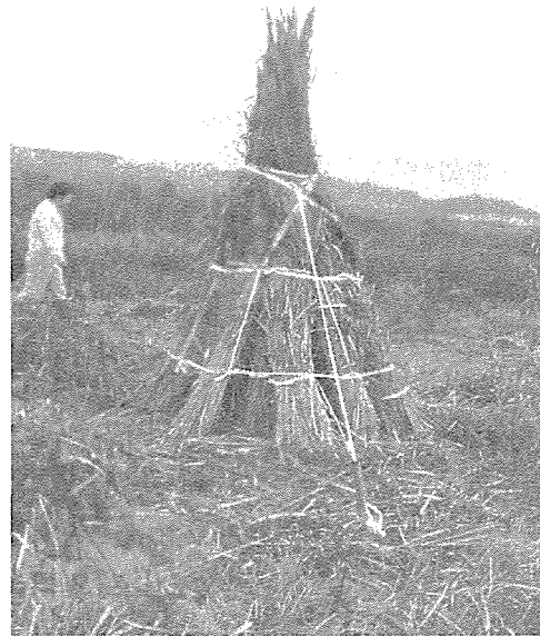
写真1. 結束し、島立てされたカヤ

さらに、文化財改修への需要などを中心に、更なるカヤの品質向上（太さの均一性や葉を取り除いて幹だけにする作業等）が求められており、こうした作業を経たものは1割程度値上げして取引されるなど更なる商品化への取組みも進みつつある。