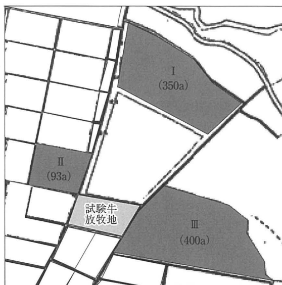
図1 放牧地周辺圃場配置

東北農業研究センターの肥育牛放牧地近傍の3ヵ所の草地(図1)から2011年6月に混播牧草を採取し放射性物質の濃度を測定した。採取方法は1ヵ所の草地につき3区画から地上より10cm高で枯れた草や土砂の混入がないよう注意して合計2kgを刈り取った。草種はオーチャードグラス、ケンタッキーブルーグラスおよびホワイトクローバーであった。14か月齢の日本短角種去勢雄牛4頭を5月26