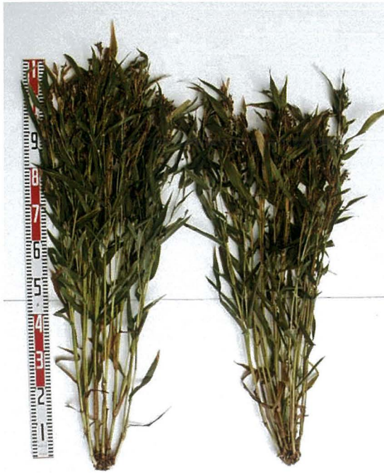
写真1 「とりいずみ」の草姿 (左：とりいずみ、右：あきしずく) 2010年10月九州沖縄農業研究センターで撮影。