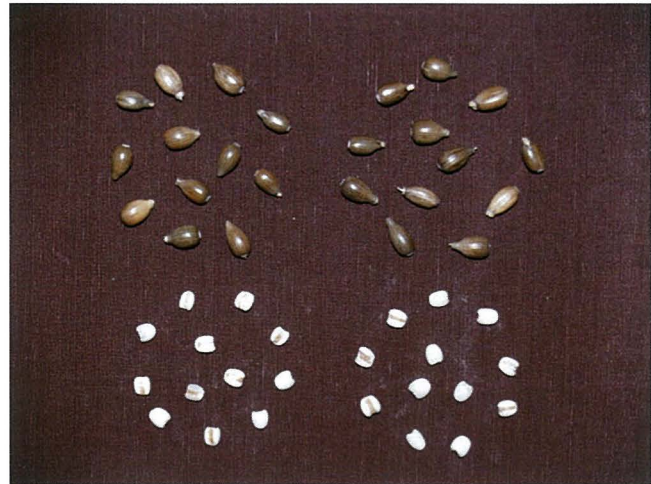
写真2 「とりいずみ」の穀実(平均粒長9.6mm, 粒幅4.9mm) (左：とりいずみ, 右：あきしずく, それぞれ上は種子, 下は 80%仕上げの精白粒)