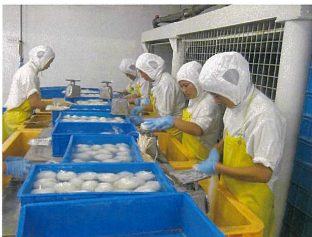
写真5 こんにゃく製品の加工 (中国)