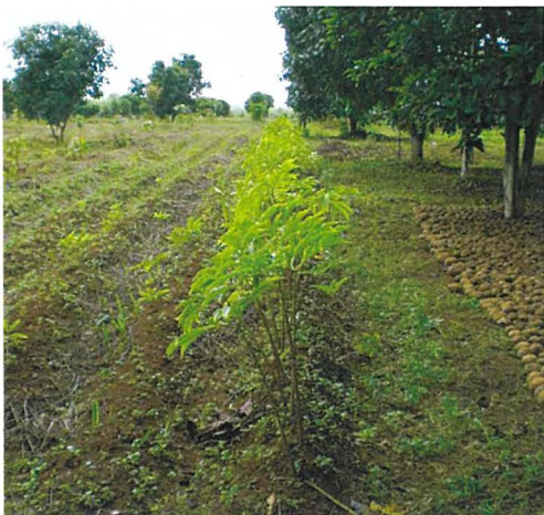
写真1 こんにゃく圃場 (ミャンマー) ①