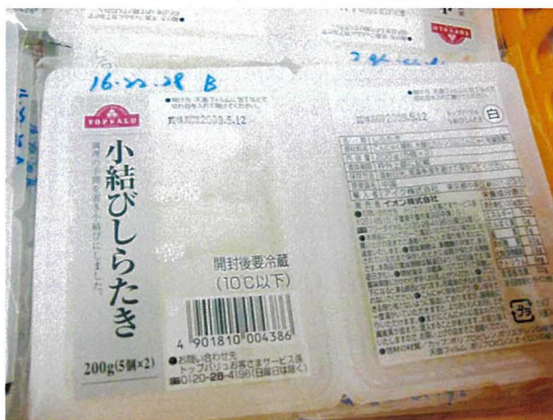
写真6 日本向けこんにゃく製品 (中国)