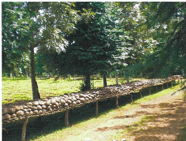
写真2 こんにゃく圃場 (ミャンマー) ②