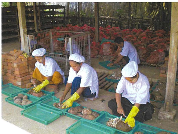
写真3 こんにゃくいもの選別 (ミャンマー)