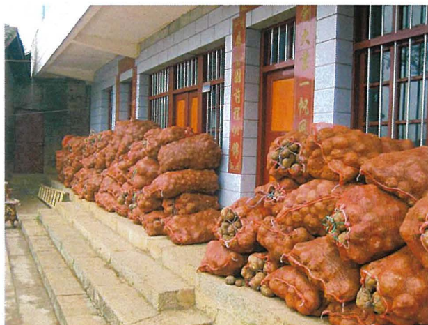
写真4 こんにゃくいもの集荷 (中国)